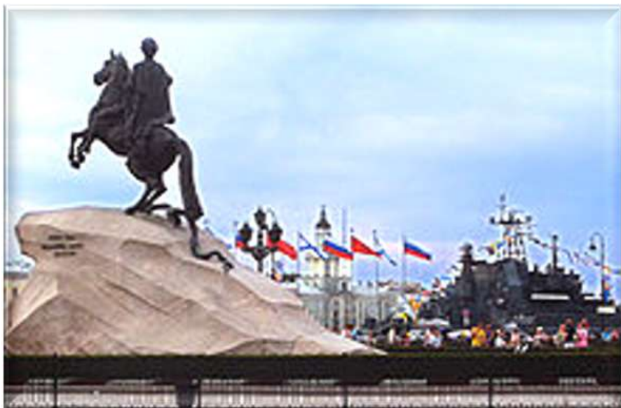
Санкт-Петербург Июль 2014 г.

— В 01.15 включен новый контроль и поддержание такта колебаний (1,008 сек.), которое и является истинным воссозданным временем Земли.