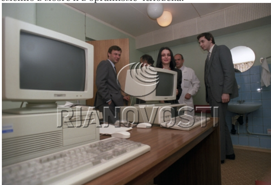
(Фото сделано «В поликлинике Гостелерадио СССР»)

Давайте посмотрим, что нового произошло за последние годы в этой области после того, как их книга появилась на прилавках магазинов. Первые исследования, проводившиеся энтузиастами и учёными, доказали наличие существенных различий в частотах работы головного мозга у лиц, находящихся в состоянии изменённого сознания (медитации, просветлении, озарении, энергетического лечения пациентов и т.п.) и частотах мозга, характерных человеку в его повседневной деятельности. Колебания одних частот – угасали, а других – возрастали. Более того, приборы регистрировали наличие частот, которые, по мнению учёных, мозг не был способен генерировать, ибо они были бы явно конфликтующими в процессах, происходящих одновременно в мозге и в организме человека.